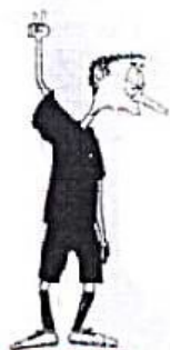
2 min. TREST