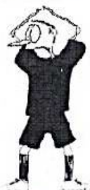
HRA V MALÉM BRANKOVIŠTI