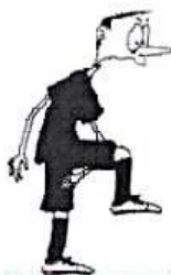
HRA MEZI NOHAMA