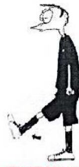
HRA VYSOKOU NOHOU