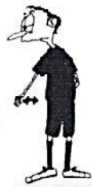
HRA NA ZEMI dlaní dolu